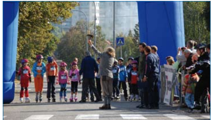
Start závodu mládeže

Na úvodní říjnovou sobotu byl naplánován první a – dá se říci – zkušební ročník „Dne radnice“, v jehož rámci se mělo sklonit sportovní zápolení, zábava a další atributy, kterých se nám v dnešní uspěchané době dostává stále méně. Na přípravě se ve spolupráci s radnicí podílel i SK Špilberk. Počasí, po celé září nádherné, se začalo kabinat, ale modlitby organizátorů nakonec byly vyslyšeny a od brzkého sobotního rána se obloha skvěla blankytnou modří. Na tom se nic nezměnilo po celý den – místo kapek deště zdravilo závodníky i návštěvníky hřejivé slunce, takřka naposledy v letošním roce.