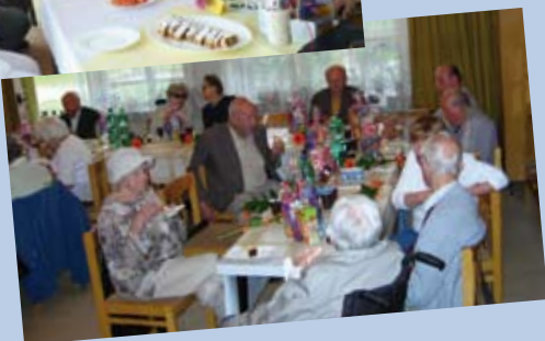
jubilanti 2. čtvrtletí 2009

Všem přejeme hodně zdraví, štěstí a radosti do dalších let.