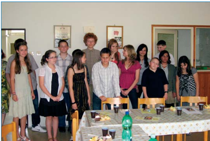
Ocenění žáci ze Starolískoveckých základních škol, červen 2009